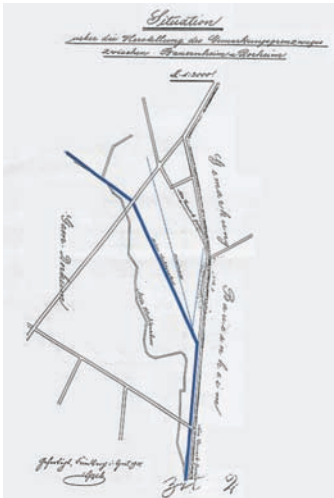
Planung der Begradigung des Hechtgrabens: "Über die Herstellung des Gemarkungsgrenzweges..."

Das NSG liegt im Naturraum Wetterau zwischen den Städten Friedberg und Florstadt und besitzt eine Größe von insgesamt 11,8 ha. Politisch gehört es zur Gemarkung Dorheim, einem Stadtteil von Friedberg.