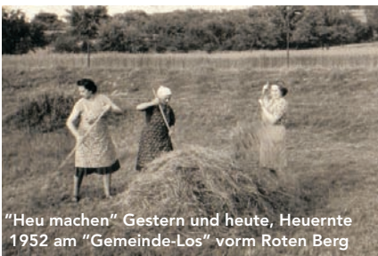
"Heu machen" Gestern und heute, Heuernte 1952 am "Gemeinde-Los" vorm Roten Berg

Nach der Renaturierung liegt nun ein Schwerpunkt der Schutzgebietspflege auf den feuchtgebundenen Lebensräumen.