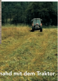
Heumahd mit dem Traktor